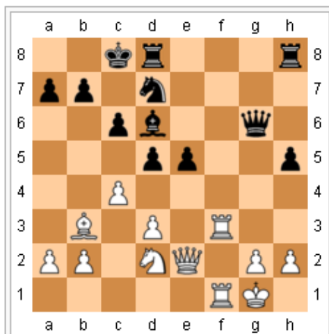
Diagramm 1: Schwarz am Zug

Philidors Werk L'analyse du jeu des échecs (1749) nimmt eine herausragende Stellung in der Schachliteratur ein. Das Buch gilt, insbesondere wegen seiner Ausführungen zur Bauernführung, als eine Grundlegung der Schachstrategie. Es enthält auch das erste bekannte Beispiel für ein rein positionell begründetes Bauernopfer im Mittelspiel (Diagramm 1).